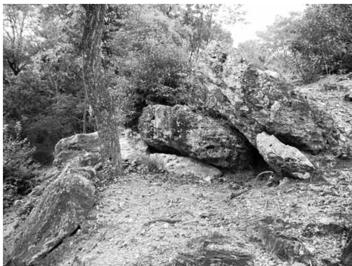
写真2 神前山の磐坐