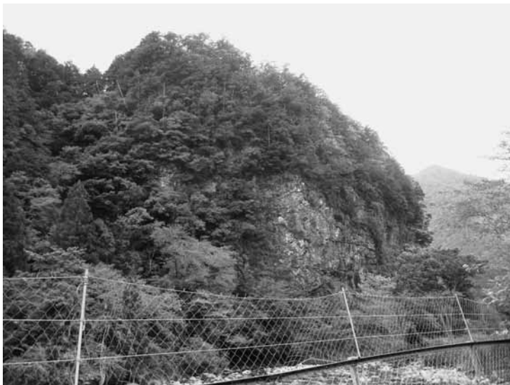
写真3 立石神社の巨岩（神河町）

三ツ山・一ツ山の神事は高畑山・花咲山・白倉山の三山、そして宮山という山を祀るもので、それぞれの山中にある磐坐の祠を六十年に一度、二十一年に一度新しいものと取り替えます。つまり、自然の山に対する信仰、その神体は磐坐であるわけですが、これが本来の三ツ山・一ツ山だというわけです。また、伊和神社本殿裏には二羽の鶴が化したとされる二つの石、「鶴石」が大切に祀られており、神社の由緒にまつわる一