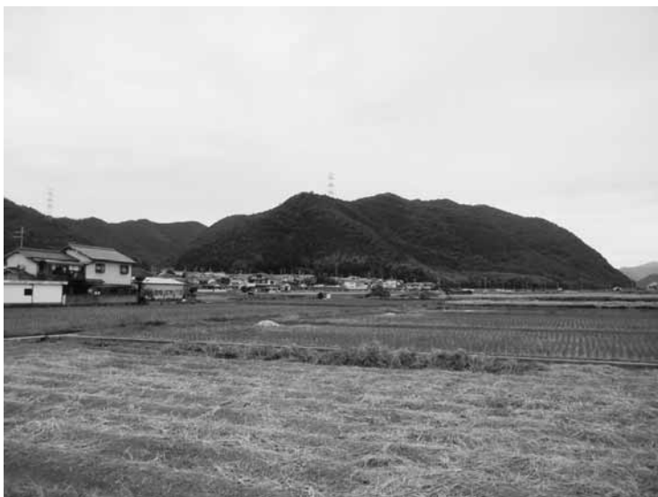
写真1 神前山（千束山を含む）

こうして記録された「旧聞異事」の数々は、当時の歴史や文化、人々の暮らしを知るための貴重な手掛かりといえます。風土記の時代にあつた播磨国の十二の郡の内、残されているのは十郡の記録ですが、幸い福崎町が属した神前郡はその中に含まれていきます。六つの里があり、記載順に並べると 聖岡里（神河町周辺）・川辺里（市川町周辺）・高岡里（福崎町周辺）・多駝里（姫路市山田町、福崎町八千種周辺）・蔭山里（姫路市豊富町周辺）・的部里（姫路市香寺町周辺）となります。揖保郡や飾磨郡に比べると話の数は多くありませんが、遺称地とされる地名がいくつも残っています。神前郡を中心に、奥深い「播磨国風土記」の世界を覗いてみたいと思います。