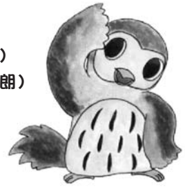
福崎町健康づくりキャラクター ふくちゃん