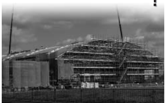
順調に工事が進む多目的ドーム