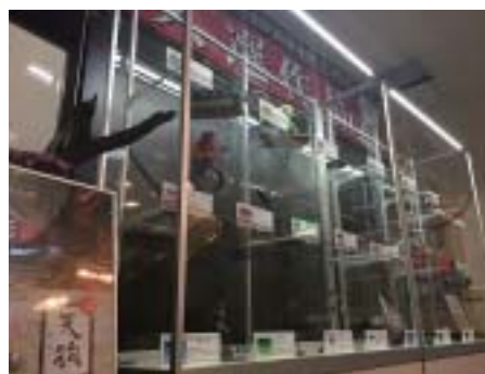
ただいま1階展示コーナーでは「全国妖怪造形コンテスト」作品展示中