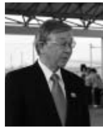
スポーツフェスティバルインタビュー

時どき、マスコミの重役と政府関係者との会食が話題になります。こんなことはできるだけ避けてほしいと思います。こんなことが続くと公