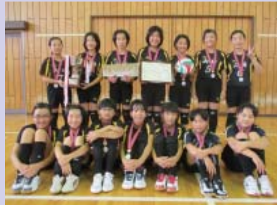
バレーボールの部 山崎子ども会 準優勝