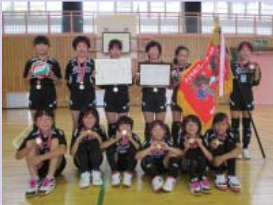
バレーボールの部 板坂・桜子ども会 優勝