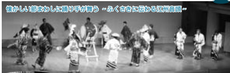
懐かしい節まわしに踊り手が舞う～ふくさきに伝わる江州音頭～