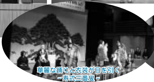
華麗な踊りと衣装が目を引き ～寿式三番叟～