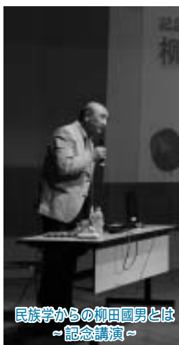
民族学からの柳田國男とは ～記念講演～