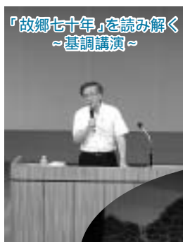
「故郷七十年」を読み解く ～基調講演～