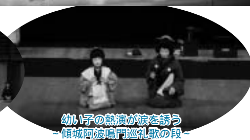
幼い子の熱演が涙を誘う ～傾城阿波鳴門巡礼歌の段～