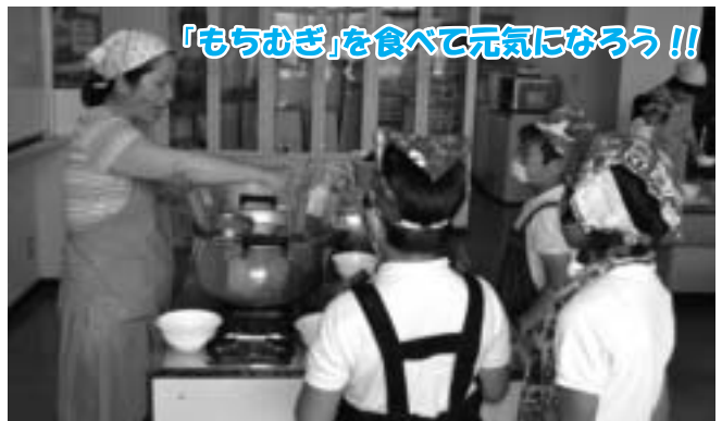
「もちむぎ」を食べて元気になろう!!

また6月2日には、「もちむぎ麵打ち体験」にもチャレンジしました。一生懸命自分たちで作ったもちむぎ麵をおいしくいただきました。