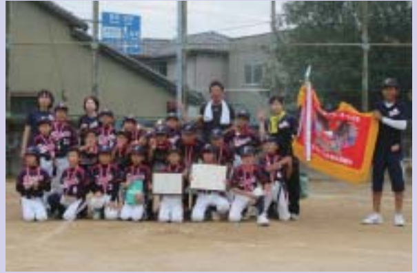
ソフトボールの部 優勝 高岡子ども会

福崎町からは、ソフトボールの部に高岡子ども会と西治・西谷子ども会、バレーボールの部に板坂・桜子ども会と山崎子ども会が代表として出場しました。4チームとも暑い中健闘し、ソフトボールの部において高岡子ども会が優勝、バレーボールの部において板坂・桜子ども会が優勝、山崎子ども会が準優勝に輝く活躍を見せました。