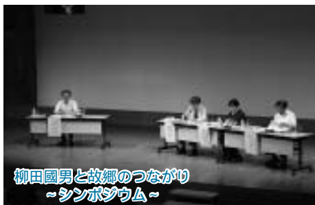
柳田國男と故郷のつながり ～シンポジウム～