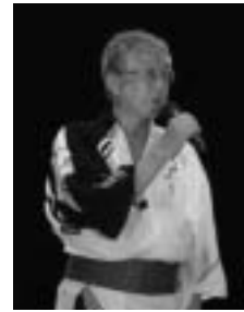
第42回 福崎夏まつり

人口減少と東京一極集中は正のため地方創生の取り組みが進んでいます。町も、まち・ひと・しごと創生総合戦略推進会議」を作りました。取り組みにあたって三つのことが気になります。