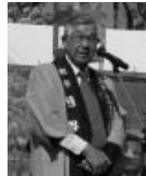
第41回 遠野市産業まつり

さて、町長と議員補欠選挙は12月6日投票で行われます。町長と議員は町政運営に責任を持つ点は共通ですが、それぞれの役割分担は違っています。町長は議会に提案する条例案や予算案を作り、議会で決定した内容を執行することとはできませんが、提出した議案を審議し決定することはできません。決定する権限は議会にあります。議員は日常生活や議案審議を通して、町政や町長をチエックし、公正な町政運営の見張り役を果たしています。