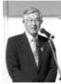
第42回 福崎秋まつり

中学卒業までの医療費の無料化、公共下水道、図書館、幼児園、さるびあドームの建設、三木家の改修、河童や天狗像の設置、小型ポンプ操作