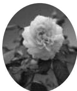
シスレーのバラ 「絆 - KIZUNA - 」

かれた教育委員会の推進。を重点目標に上げ、取り組んでいます。課題も山積していますが、いろんな立場の方々のご支援をいただきながら、一歩一歩前進しています。「福崎で育つて、学んで、住んで良かった」と言ってもらえるよう頑張ります。