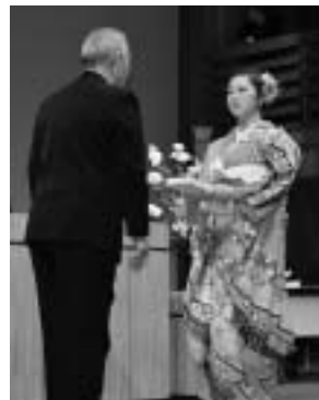
アトラクションのようす