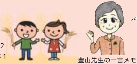
豊山先生の一言メモ

チョコレートの原材料のカカオ豆は、カルシウム、鉄、マグネシウム、亜鉛などミネラルがバランスよく含まれています。その香りは、集中力、記憶力を高め、リラックス効果も期待できます。 チョコレートの風味を保つために、焼きあがったら急いでオーブンから取り出しましょう。