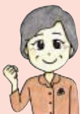
豊山先生の一言メモ

トマトに含まれる成分「リコピン」は、強力な抗酸化作用があります。生活習慣病の原因抑制、夏バテ防止、疲労回復効果も期待できます。