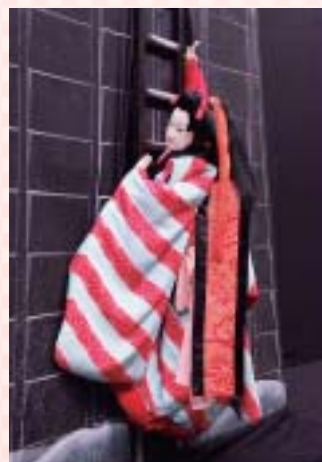
伊達娘恋緋鹿子 火の見櫓の段

演目 戎舞 人形浄瑠璃レクチャー 伊達娘恋緋鹿子 火の見櫓の段 一谷嫩軍記 須磨浦組討の段