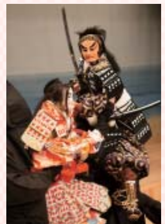
一谷嫩軍記 須磨浦組討の段