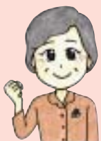
豊山先生の一言メモ

バナナは、すばやくエネルギーの補給ができ、整腸作用があります。もち麦に含まれる-グルカンの相乗効果も期待でき、健康パワーがUP!