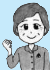
豊山先生の一言メモ

さつまいもともちむぎ粉が程よく混ざった和菓子で便秘解消！免疫力を高めて風の予防、美肌効果も期待しましょう。