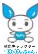
献血キャラクター「びびっちゃん」