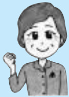
豊山先生の一言メモ

ぜんざいはお正月に年始を祝って食べる地方もあります。 小豆は、あんやお赤飯など日本の文化に深く関わっている豆で す。小豆はビタミンB1、B2が豊富で、もち麦との相性もよ く健康パワーUP! また、小豆に含まれるサポニン、せきの 鎮静、むくみの防止、便秘解消などの効果が期待できます。