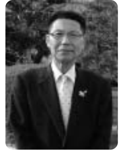
福崎町長 橋本省三