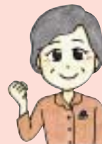
豊山先生の一言メモ

消化のよいたんぱく質の卵とはんぺん、ぬるねばオクラを加え、さらにサクサク激からのポテトチップスをたっぷり振りかけた栄養満点のもちむぎ丼・・・新陳代謝向上、持久力UPがもちむぎパワーに拍車をかけます。冬のなごりの寒い日に食育フェア人気の丼、この一杯が明日への力に繋がります!