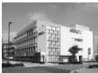
神戸陽子線センター外観