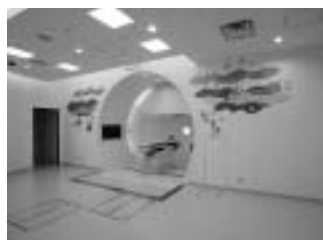
神戸陽子線センター照射室