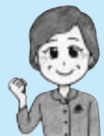
豊山先生の一言メモ

サバはDHA、EPAの宝庫、トマトは抗酸化力UP食品、井を食べたいと思う時の救世主になります。手軽な栄養満点井は「おいし~い」の一言です!