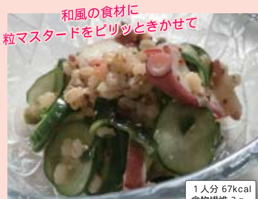
1人分 67kcal 食物繊維 2g