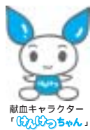
献血キャラクター「はなちゃん」