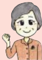
神戸医療福祉大学 豊山先生の一言メモ