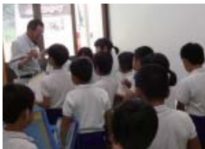
もち麦の生産者から話を聞きました

小学生が地域の農業に興味をもち、特産品などに対する関心を深め、農業が命をつなぐ大切な産業であることを理解するための学習です。