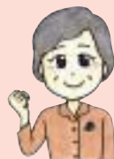
神戸医療福祉大学 豊山先生の一言メモ

ダイエットに最適な食品・鶏胸肉、食物繊維の多いごぼう、鉄補給の助っ人・意外なえのきたけ、一カロテン含有量がトップのにんじんを取り合わせた、おなかすっきり、栄養たっぷり、もちもち食感のもちむぎ炊き込みごはん！