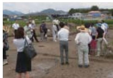
現地説明会のようす