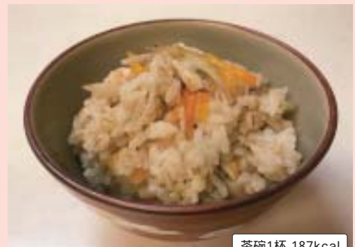
茶碗1杯 187kcal 食物繊維 2.6g

「もちむぎご飯」は、精麦の2倍の水を加えて炊飯すると、もちもちした食感に炊きあがります。