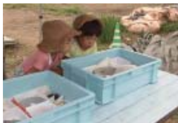
土器をみる子どもたち

7月28日（土）に現地説明会を開催したところ、地元吉田区の方を中心に、55人の参加がありました。みなさんに、ふだんは博物館などの展示ケース越しにしか見ることができない土器に触れたり、生の発掘調査現場を見学する機会を提供することができました。