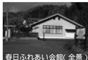
春日ふれあい会館(全景)

春日ふれあい会館がリニューアルして使いやすくなっています。子ども会行事やサークル活動などにご利用ください。