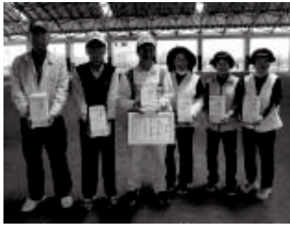
山崎グラウンドゴルフ同好会Aのみなさん