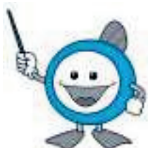
下水道マスコットキャラクター「スイスイ」

消費生活の相談や問い合わせ、苦情は、神崎郡消費生活中核センターへ (☎22・4977)