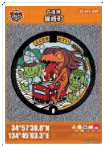
この絵柄のマンホール蓋はJR福崎駅前広場に設置しています

※しばらくの間は休日も配布しています。 配布枚数は一人一枚です。事前予約や郵送は不可。