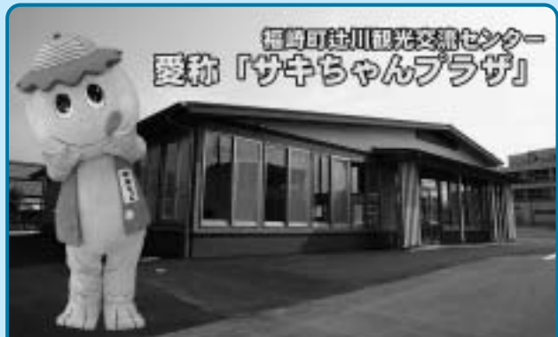
福崎町辻川観光交流センター 愛称「サキちゃんプラザ」

センターの前には多目的に使用できる交流広場があり、さまざまなイベントに使用できます。