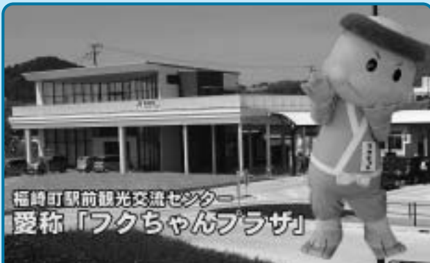
福崎町駅前観光交流センター 愛称「フクちゃんプラザ」

なお、『フクちゃんプラザ』『サキちゃんプラザ』は、指定管理施設として株式会社PAGEが管理・運営します。