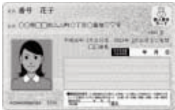
(みほん) マイナンバーカード

サービスを受けるためには、利用者証明用電子証明書が搭載されたマイナンバーカードが必要です。通知カードや住民基本台帳カード、印鑑登録証などでは利用できませんのでご注意ください。